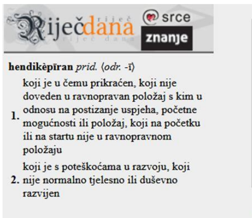
6. slika: Riječ dana na Hrvatskome jezičnom portalu

Osnovna škola Turnić Rijeka provodi za svoje učenike izbor za riječ mjeseca ( http://os-turnic-ri.skole.hr/?news_hk=1&news_id=6246&mshow=290 ). Pokrenut je prvo Rujanski izazov , a budući da je on izazvao veliki interes, učiteljice hrvatskoga i engleskoga jezika odlučile su u suradnji s knjižničarkom provesti nastavak izazova tijekom cijele školske godine. Cilj je učenje i upotrebljavanje novih riječi. Riječ je mjeseca listopada 2022. praskozorje .