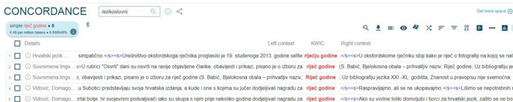
1. slika: Potvrde za svezu riječ godine u Jezikoslovnome korpusu

Suvremena lingvistika te iz znanstveno-popularne knjige Domagoja Vidovića O rodu jezikom i pokoja fraška (1. slika